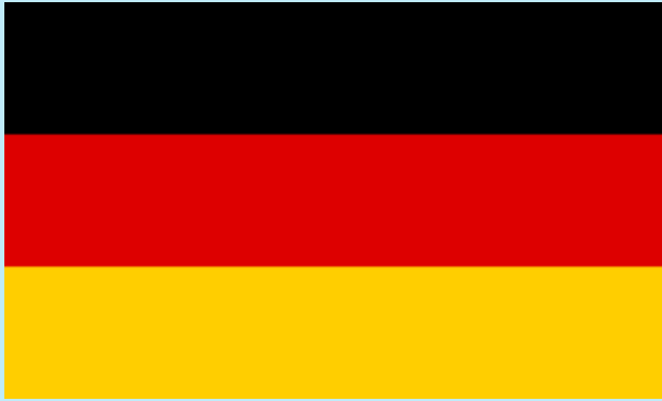
Deutsche 148 000