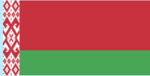
Weißrussen 47 000