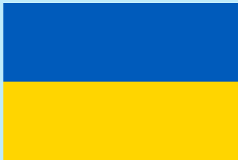
Ukrainer 51 000