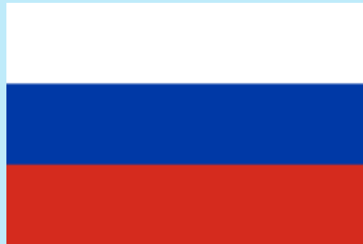
Russen 13 000